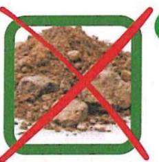
FÖLD, HOMOK, KÖVEK